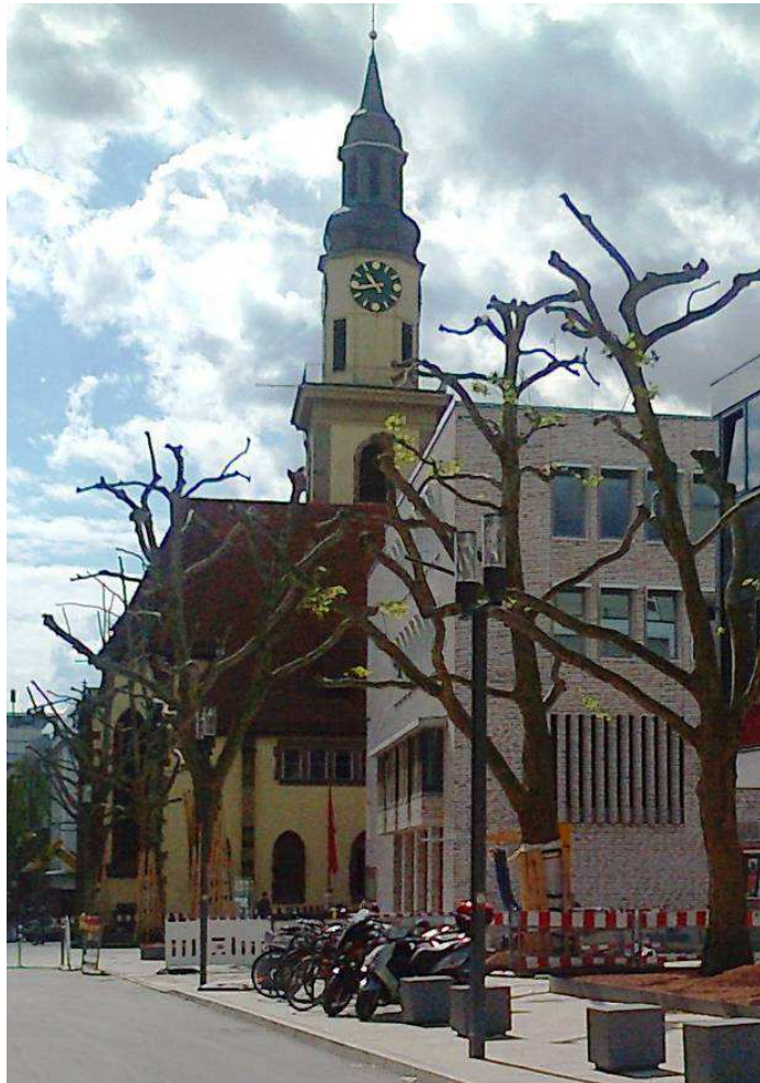
Hospitalkirche und Hospitalhof