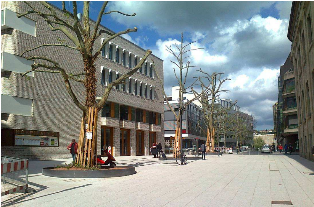
Neue Fußgängerzone in der Büchsenstraße