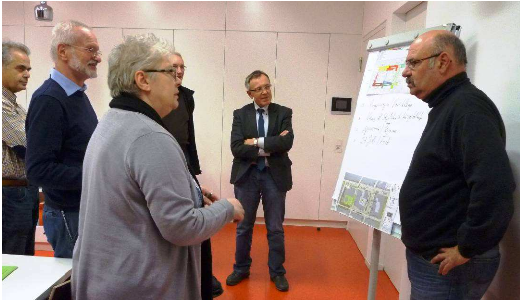
Treffen der Baubegleitgruppe