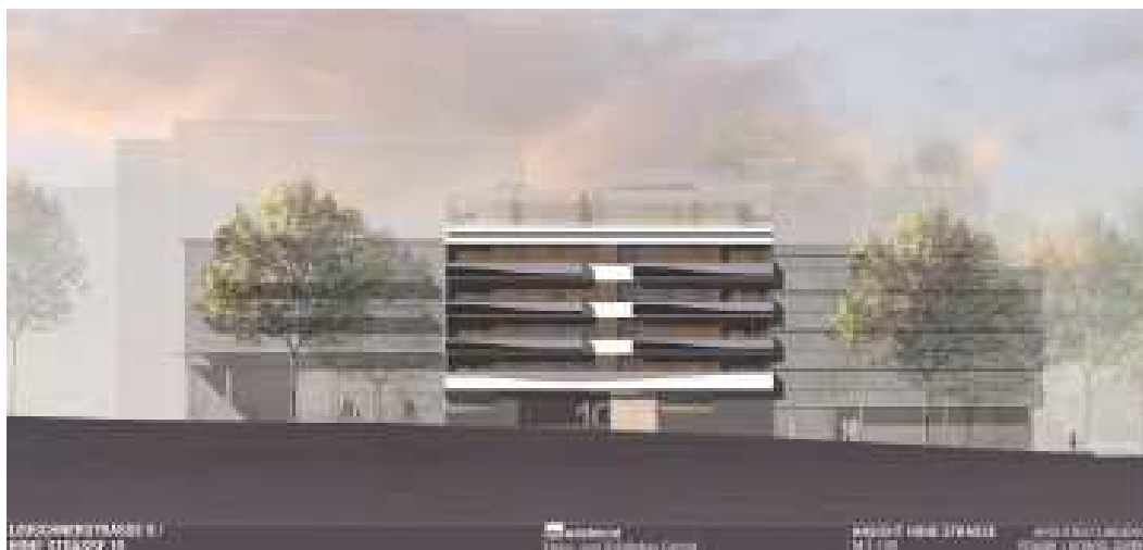
Wohnbauprojekt der WHS

Es ist erfreulich, dass das Hospitalviertel zunehmend zu einem attraktiven Wohnviertel in der Stuttgarter City wird. Seit 2010 hat die Wohnbevölkerung im Quartier um ein Zehntel zugenommen. Vermutlich wird die Zahl der Bewohner in den nächsten Jahren noch weiter ansteigen.