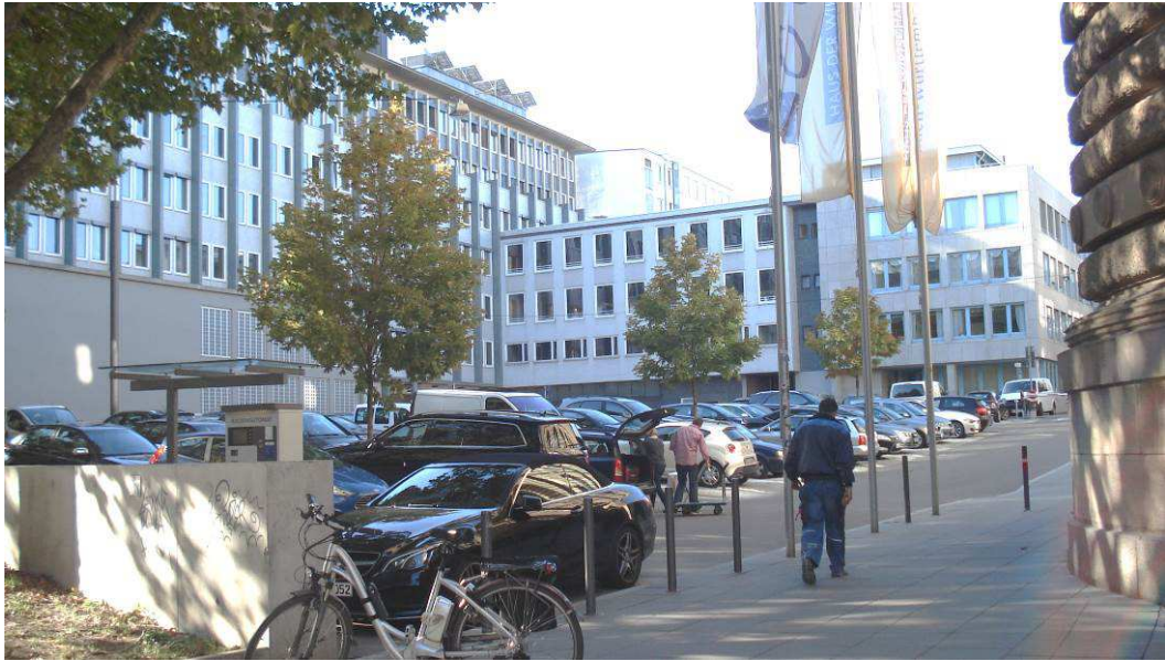
Parkplatz am Wirtschaftsministerium