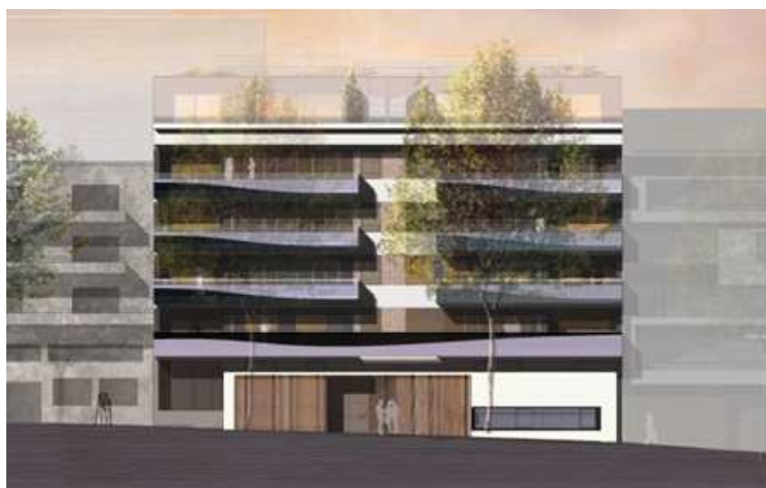
Wohnbauprojekt der WHS

Im Hospitalviertel plant die Wüstenrot Haus- und Städtebau GmbH (WHS) ein neues Wohnbauprojekt in der Leuschnerstr. 9 / Hohe Str. 10 . Über sechs Geschosse sollen Zwei- bis Vier-Zimmer-Wohnungen entstehen. Der Innenhof zwischen den Gebäudeteilen wird begrünt. Der Baubeginn soll im Jahr 2016 stattfinden. Insgesamt entstehen 31 Wohneinheiten zwischen 50 m 2 und 130 m 2 . Es ist erfreulich, dass das Hospitalviertel zunehmend zu einem attraktiven Wohnviertel in der Stuttgarter City wird. Seit 2010 hat die Wohnbevölkerung im Quartier um ein Zehntel zugenommen.