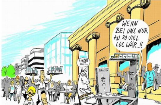
In den Ferien weht in Stuttgart ein anderer Wind. Foto:

Selten sind Straßen und Bahnen so leer wie in der vierten Ferienwoche in Stuttgart. Doch es gibt auch das Gegenteil – und manche Überraschung.