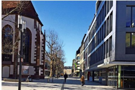
Investoren reißen sich um Immobilien rund um den Hospitalplatz.

Das Forum Hospitalviertel hat dafür gesorgt, dass aus einem Hinterhof der Stuttgarter City ein Boulevard wurde. Jetzt wird die Bürgerinitiative selbst Opfer der Aufwertung – und muss aus ihren Büroräumen ausziehen.