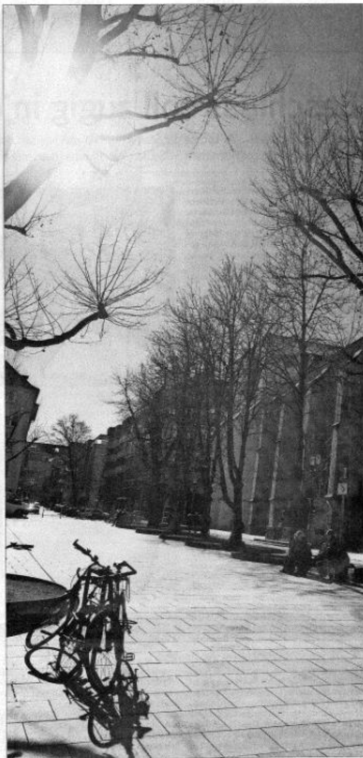
Der neu gestaltete Hospitalplatz lockt Investoren ins Viertel.

Ob das funktioniert, könnte schon bald auf den Prüfstein kommen. Denn die nächsten städtebaulichen Verschönerungsprojekte des Forums sind bereits definiert: Es will Einfluss auf die Stadt nehmen, den Leuschner Platz und die Freifläche an der Ecke Büchsenstraße/Schloßstraße herauszuputzen. Außerdem will Böhringer den Verkehr im Viertel etwas beruhigen. Für die Immobilienpreise geht es dadurch wohl weiter nach oben. Die Frage ist, was die Investoren daraus machen.