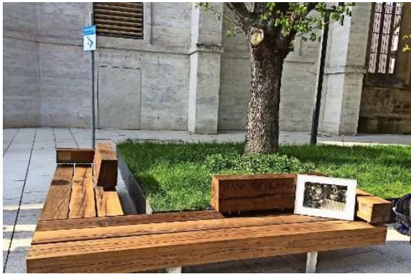
Berthold Brecht (im Bilderrahmen) kritisierte Finanzinstitute; eine Bank wie diese im Hospitalviertel hätte ihm aber vermutlich gefallen. Foto:

Von Sascha Maier 10. April 2017 - 11:00 Uhr