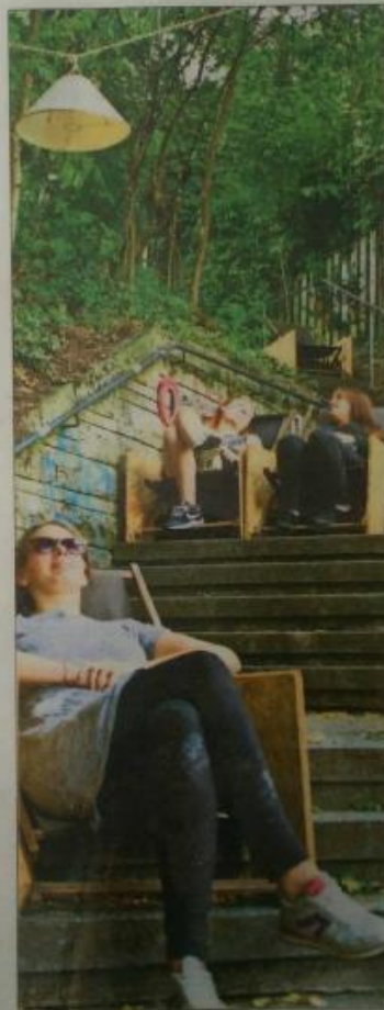
Treffpunkt Stäffele: Das Sommer-Projekt gehörte auch zu den Experimenten.

Die Idee hinter dem Reallabor? Was wäre, wenn Stuttgart auf einmal eine Stadt ohne lärmenden Verkehr, Feinstaub und zugesperrte Ecken wäre, sondern mit lebendigen Nachbarschaften und Möglichkeiten zur Teilhabe im öffentlichen Raum? Seit Anfang 2015 haben die Wissenschaftler dieses Gedankenspiel erforscht. In einem Abschlusskongress stellen die Projektbeteiligten nun