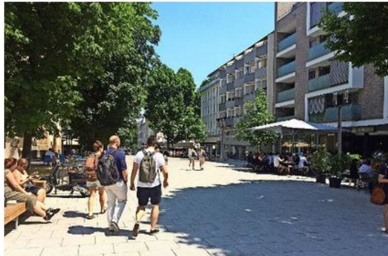
Das Forum Hospitalviertel (oben) soll mit öffentlichen Geldern

drückt: Es sind die Problemviertel, die die Stadtteilpolitiker weiterhin umtreiben, wobei weniger neue Wege beschritten werden sollen, als mehr alte weitergegangen. Besonders setzen die Bezirksbeiräte dabei offenbar auf die Unterstützung von privaten Bürgerinitiativen.