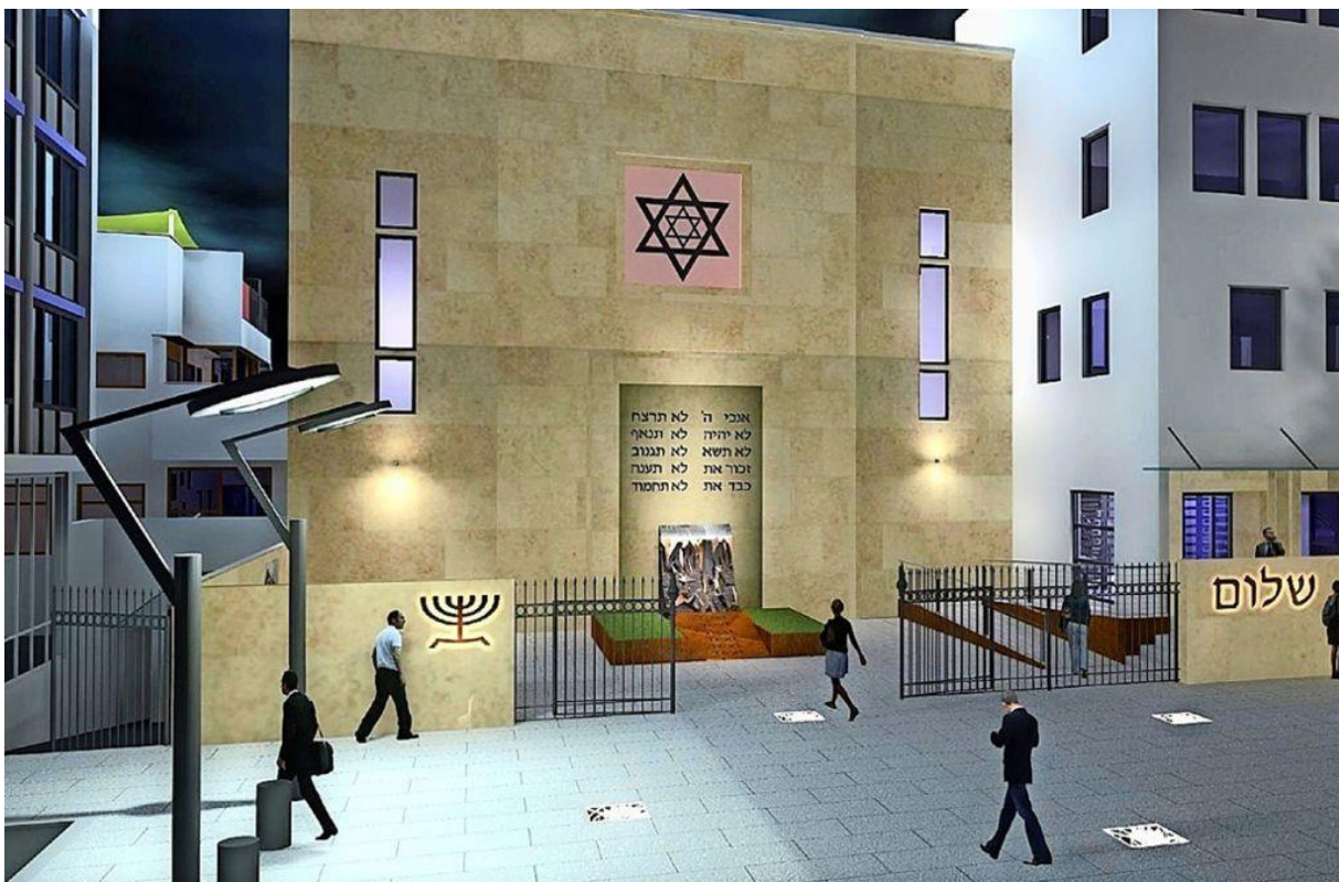
Foto: Jossi Abiry Entwürfe für den neuen Synagogenvorplatz des Architekten Jossi Abiry

Erfreulicherweise ist inzwischen vorgesehen, auch den Abschnitt der Hospitalstraße zwischen Lange- und Gymnasiumstraße neu zu gestalten. Das Forum wird bei der Beteiligung und Umsetzung einbezogen und organisiert mit. Damit wird die Hospitalstraße in einem Guss von der Fritz-Elsas- fast bis zur Kienestraße aufgewertet.